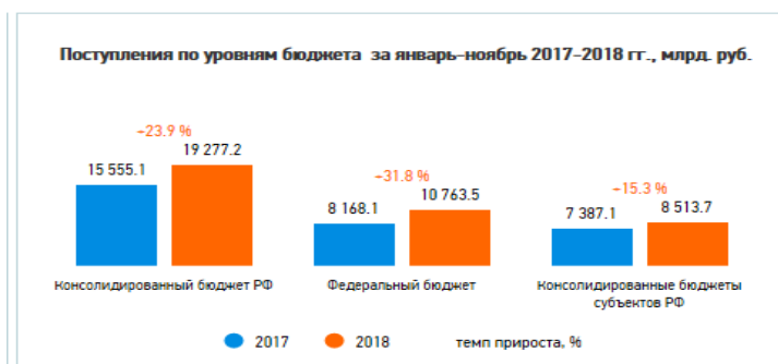
Рис.1.1 Поступление налогов по уровням бюджетной системы за 2017-2018гг. 1

Если графический материал является авторской разработкой, то это необходимо отметить.