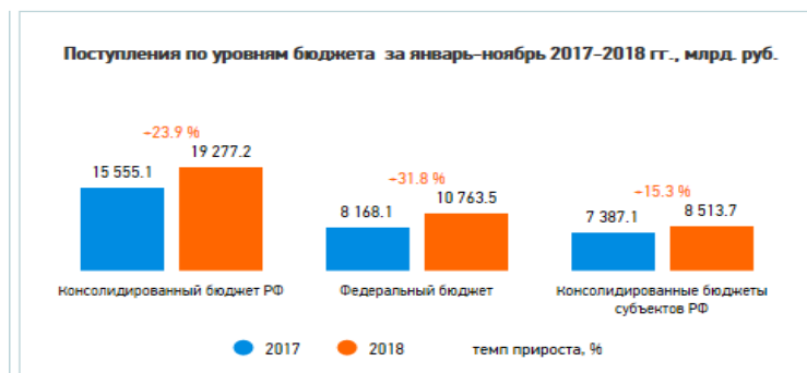
Рис.1.1 Поступление налогов по уровням бюджетной системы за 2017-2018гг. 1

Если графический материал является авторской разработкой, то это необходимо отметить.