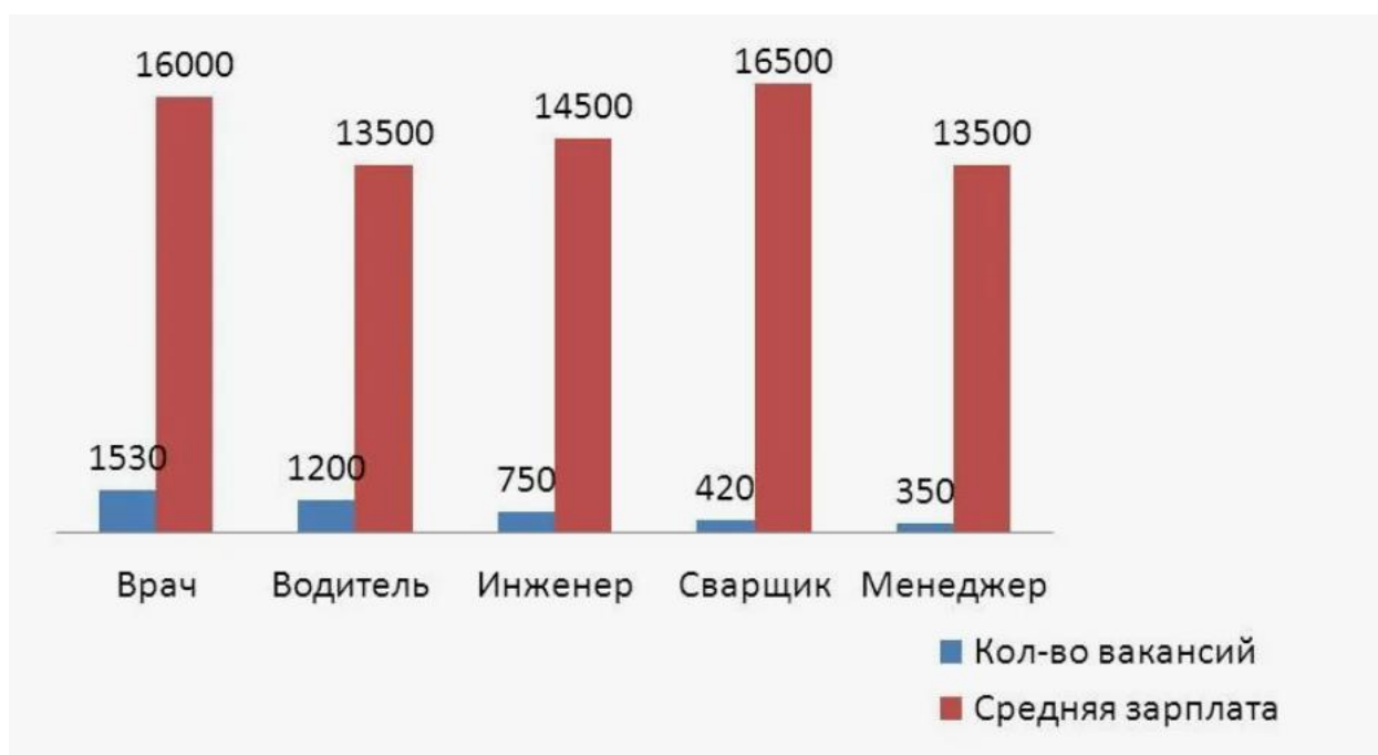
Рисунок 1 – Анализ рынка труда