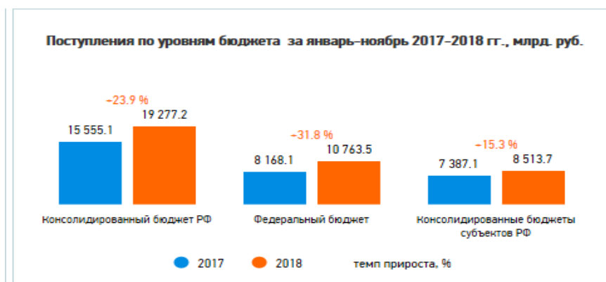
Рис.1.1 Поступление налогов по уровням бюджетной системы за 2017-2018гг. 1

Если графический материал является авторской разработкой, то это необходимо отметить.